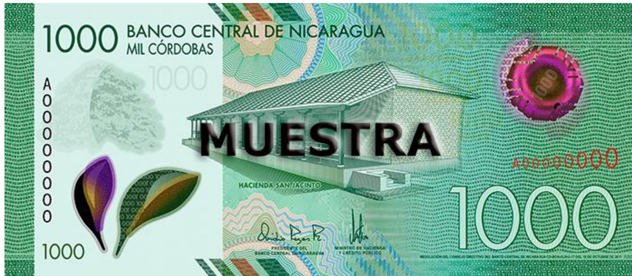
Anverso (Hacienda San Jacinto)