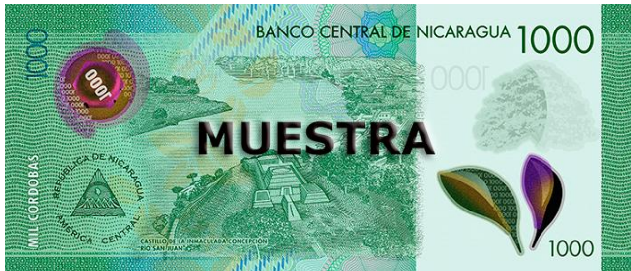
Reverso (Castillo de la Inmaculada Concepción Río San Juan)